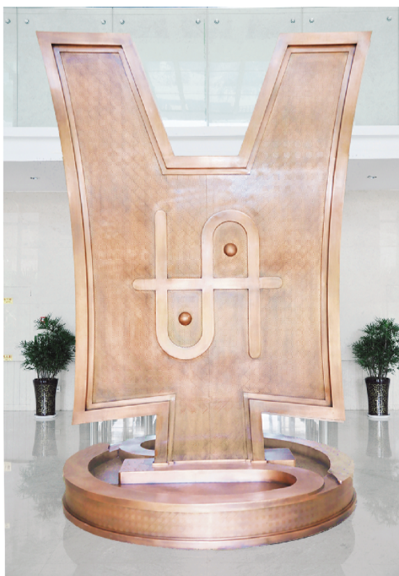
图为安放在邯郸大厦中楼一层大厅的赵币铜雕。